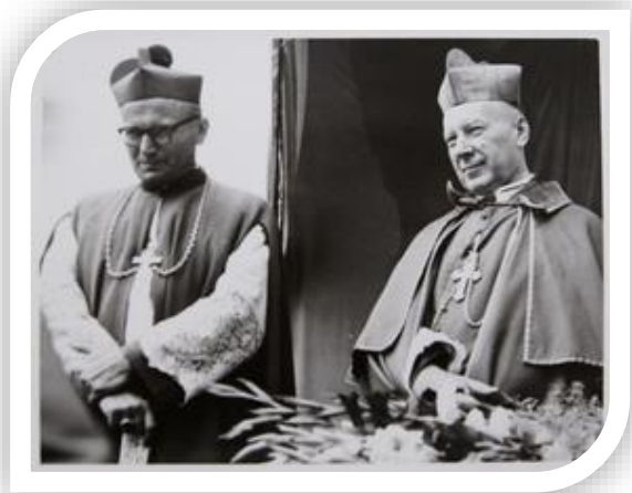
Przyszły papież Karol Wojtyła oraz kard. Stefan Wyszyński w sanktuarium Matki Bożej w Ludźmierzu.