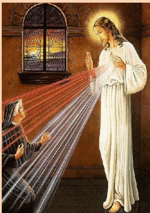
Wizja obrazu Jezusa Miłosiernego

Rysunek obrazu został ukazany w wizji, jaką Siostra Faustyna miała 22 lutego 1931 roku w celi płockiego klasztoru. Wieczorem, kiedy byłam w celi – pisze w Dzienniczku – ujrzałam Pana Jezusa ubranego w szacie białej. Jedna ręka wzniesiona do błogosławieństwa, a druga dotykała szaty na piersiach. Z uchylenia szaty na piersiach wychodziły dwa wielkie promienie, jeden czerwony, a drugi biały. (...) Po chwili powiedział mi Jezus: Wymaluj obraz według rysunku, który widzisz, z podpisem: Jezu, ufam Tobie (Dz. 47). Chcę, aby ten obraz (...) był uroczyście poświęcony w pierwszą niedzielę po Wielkanocy, ta niedziela ma być świętem Miłosierdzia (Dz. 49).